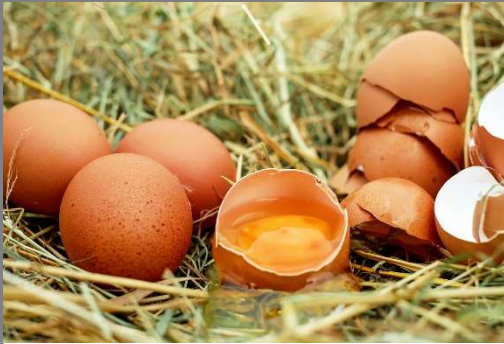
l œf – lè z-œ

Mémoriser du vocabulaire avec sa prononciation et sa graphie en orthographe.