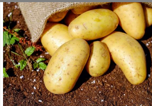
la pom dæ tèt – la patat