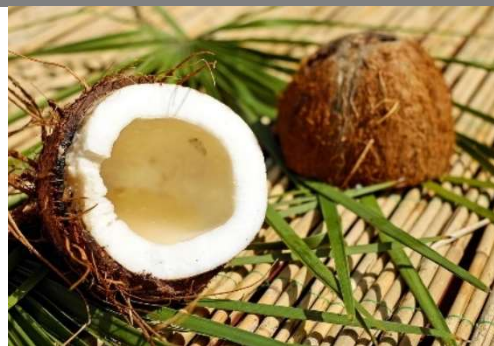
la nwa dæ coco