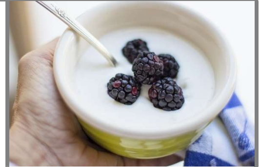
lœ yawrt – lœ yogwrt